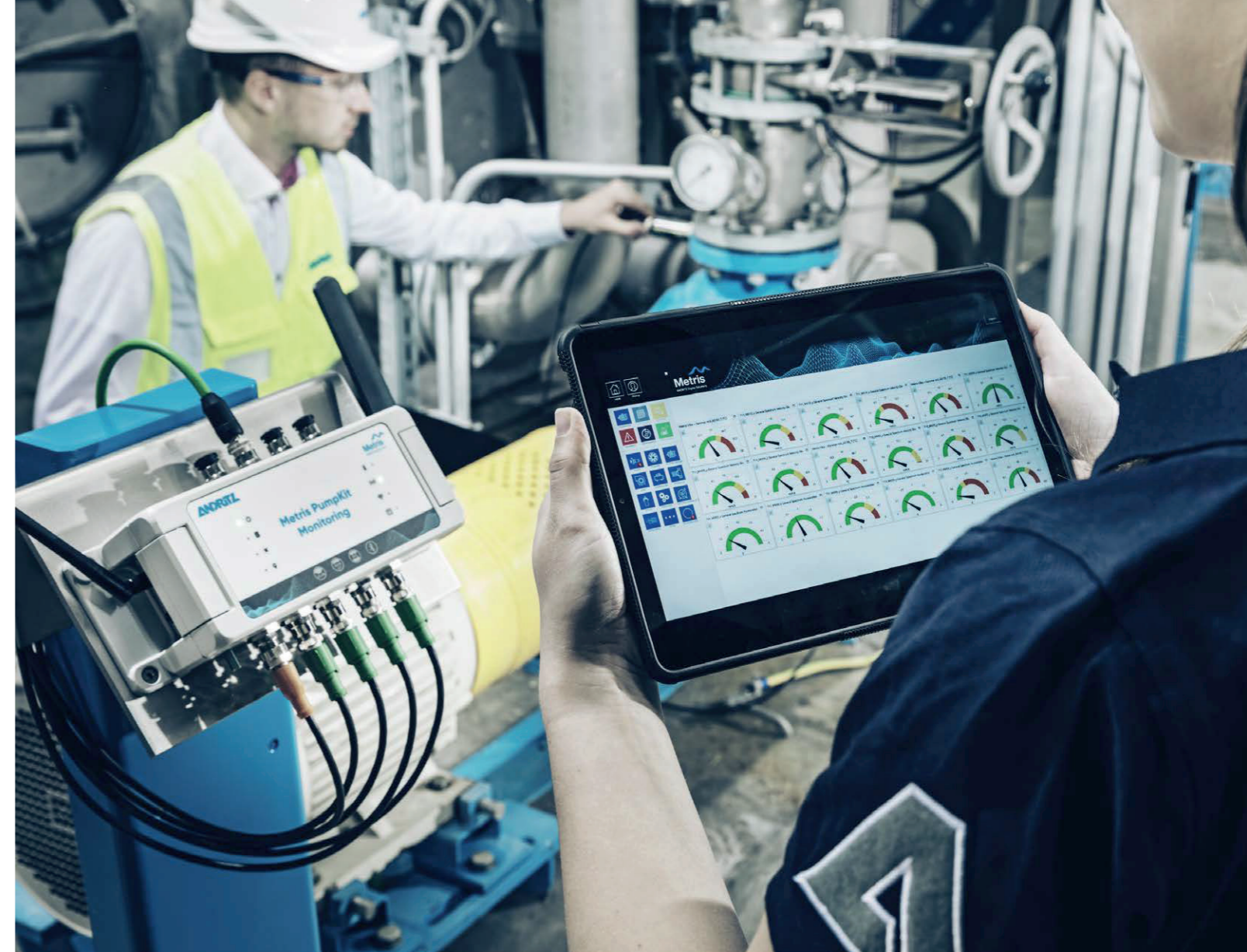
PumpKit会自动分析大量数据，并提供清晰的评估和处理建议。

无论其他系统或现有基础设施如何，Metris PumpKit都可以随时进行改装。事实上，许多现有的泵和其他机械设备仍在“盲目”运行，因为它们在工厂中的定位使监测变得不可能。Metris PumpKit有助于泵的监控，无需支付巨额成本或进行设备升级，是工业4.0的快速便捷入门之路。